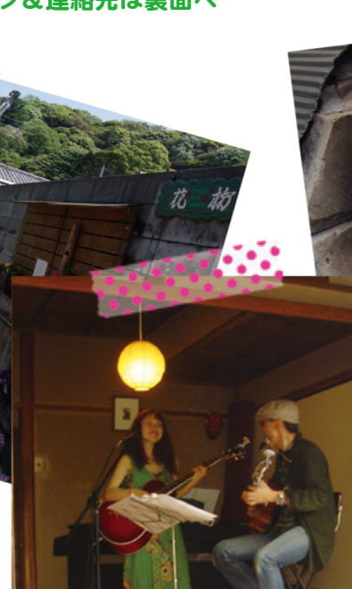
パフォーマンスあり！